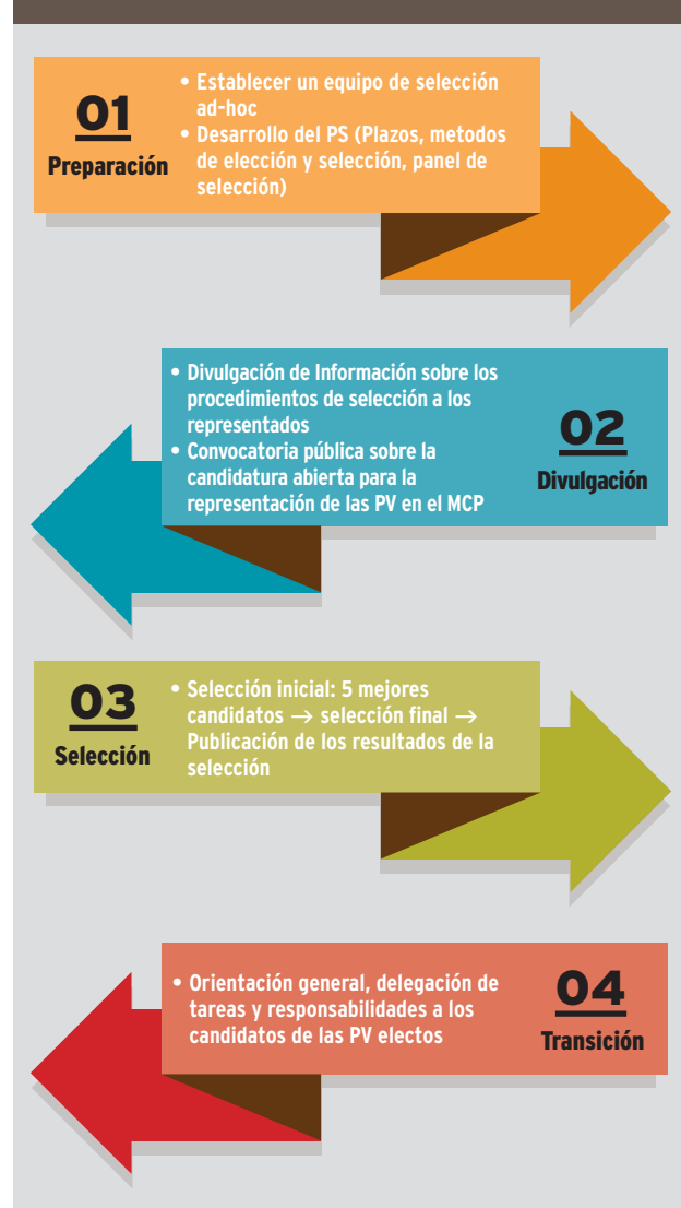
Gráfico 1. Pasos para seleccionar un representante de las PV en el MCP

Durante la etapa de transición, el representante de las PV en funciones en el MCP debe proporcionar una orientación general y discutir el trabajo en curso que se requiere continuar. Esta etapa requiere del apoyo y la asistencia de la comunidad de las PV y el FM en general.